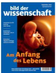
BILD DER WISSENSCHAFT