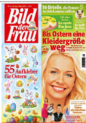
BILD DER FRAU erscheint am 13.03. mit niedlichen Osterstickern . Bitte platzieren Sie den Titel auffällig und sorgen Sie so für Zusatzumsatz!