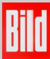
BILD investiert jährlich 400.000 € für das tägliche Händlerplakat

Am 24. 10. informiert das neue FLIEGER REVUE X-SONDERHEFT über die Zivilluftfahrt in der DDR . Das hochwertig ausgestattete Magazin liefert interessante Lektüre über ein spannendes Stück Luftfahrtgeschichte. Zum Preis von 14,90 € findet der Kunde aufwändig bebilderte und recherchierte Artikel.