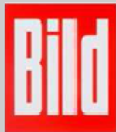
BILD startete am 11. Juni 2013 mit BILD plus

Am 11.6. verspricht LANDIDEE LANDGARTEN mit dem Titelthema „Was für ein Sommer“ den Lesern Gartenglück und Sonnentage. Das beiliegende Extra informiert über Pflanzen für Vegetarier. Platzierung bitte neben MEIN SCHÖNER GARTEN . VK: 4,50 €