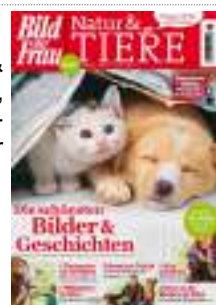
BILD DER FRAU SONDERHEFT „NATUR & TIERE“ präsentiert auf 76 Seiten neben „Die schönsten Tier-Bilder & Geschichten“, Themen wie „Therapeuten auf vier Beinen“, „Reisen zu den Wundern der Natur“ und das „Große Tier-Rätsel“. Die Zeitschrift kostet 2,50 € und unterstützt wird der Verkauf durch Anzeigen in verlagseigenen Zeitschriften.

Platzierung im Regal: Im Segment der Tierzeitschriften