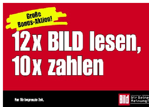
BILD startet am 31.08. wieder unter dem Slogan „ 10 zahlen - 12 lesen “ mit der großen Bild-Bonus-Aktion . Sie erhalten die bekannten Bild-Gutscheinhefte zum Preis von 5,00 €. Sie gelten wie immer für eine begrenzte Zeit. Seien Sie dabei - Sie können nur gewinnen - denn Sie profitieren, weil Ihre Käufer sparen.

Das SPORT BILD SONDERHEFT CHAMPIONS LEAGUE 2011/2012 ist am 31.08. erhältlich. Auf 136 Seiten findet der Leser viel Wissenswertes über alle Mannschaften, alle Spieler, die kompletten Spielpläne zum Europapokal, umfangreiche Statistiken, Porträts der großen Stars und vieles mehr. Großformatige Printanzeigen in verlagseigenen Zeitschriften unterstützen den Abverkauf des Sonderheftes in den nächsten 12 Wochen.